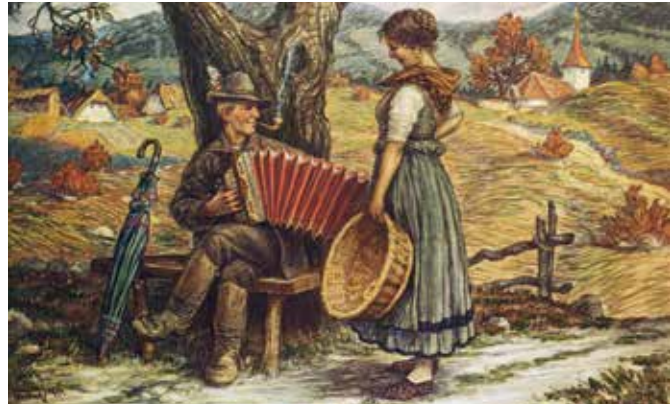
Harmonikar in dekle, 1917.

bolj in le redki so se obotavljali pri odločitvi, da bi na pročelje svoje hiše razstavili hišno ime, ob katerem je reprodukcija poljubne njegove razglednice, ki po pokrajini spominja na Menišijo.