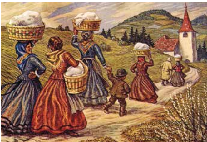
Velika noč, 1917.