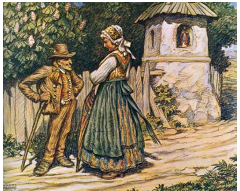
Bogati ženin, 1917.