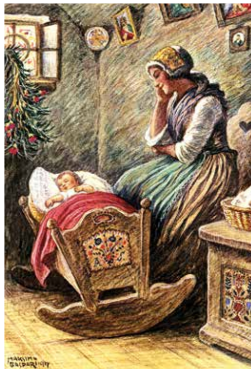
Ob zibelki, 1917.