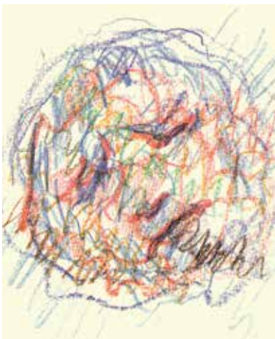
Slikice, ki jih je ustvarjal pred smrtjo.