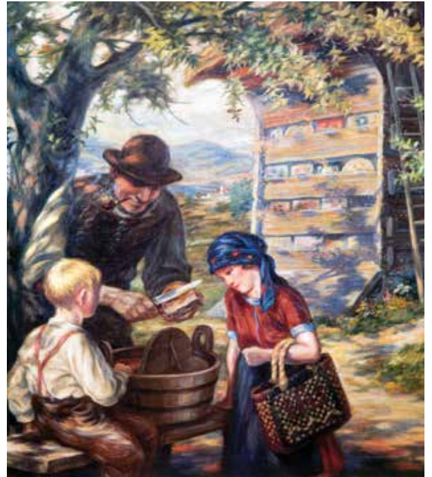
Dekle ob čebelnjaku, 1925.