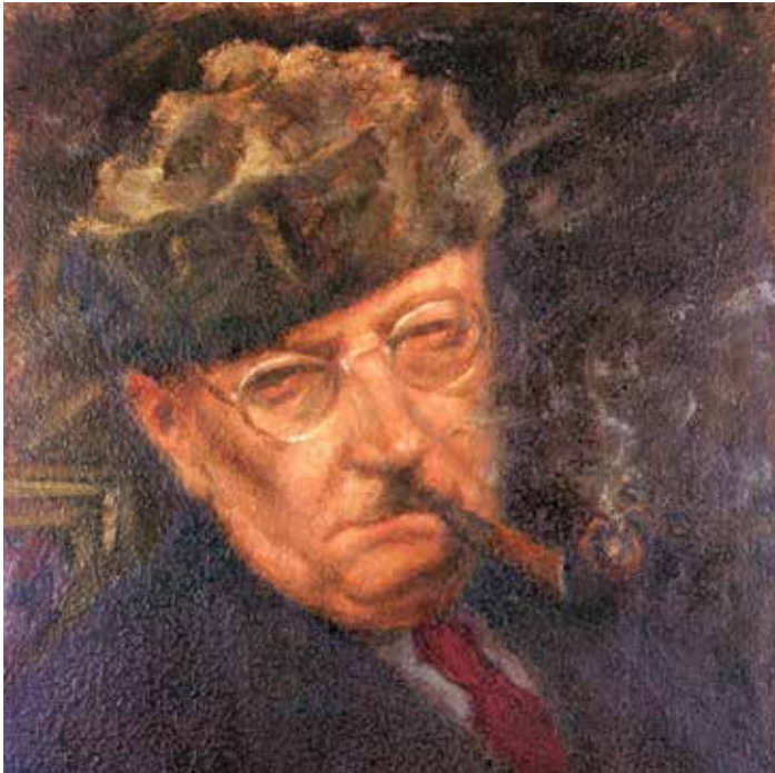
Lastna podoba s pipo, 1951.