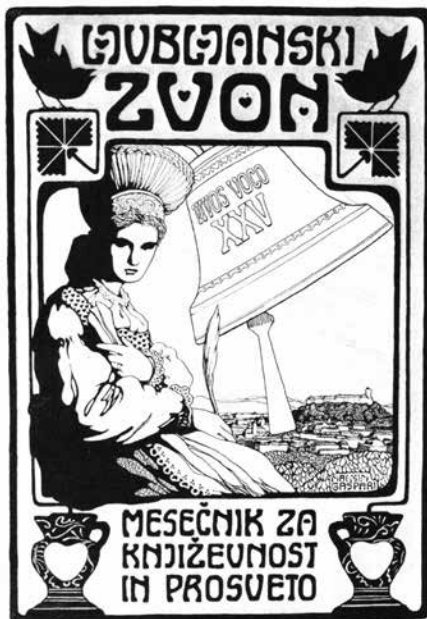
Predloga za Ljubljanski zvon, 1905.